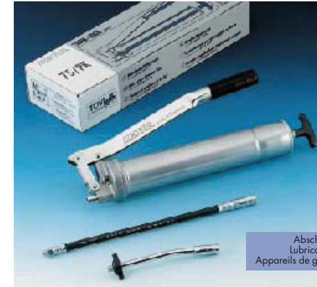
Abschmiersets Lubrication sets Appareils de graissage