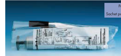
Polybeutel Polybag Sachet polyamide

Qualité et fonctionnalité s'accordent avec design et sécurité optimale au niveau de la poignée. Le „must“ d'UMETA en matière de qualité est zingué, muni d'une valve de remplissage de série et livré en carton individuel imprimé.