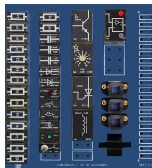
Zubehörsatz (Typ 1017.11)