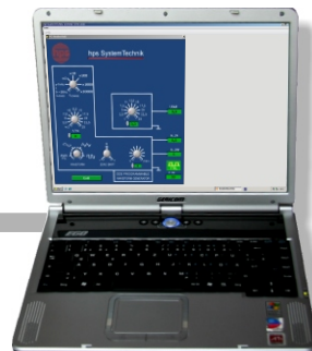
PC (nicht im Lieferumfang) zur Ansteuerung des PC BASIC ELECTRONIC BOARD