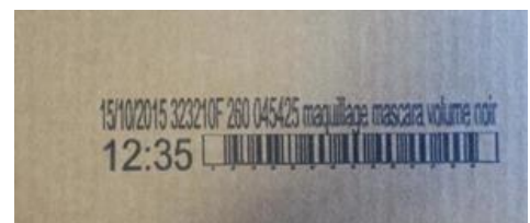
Exemples de réalisations de marquages sur carton avec le TI250